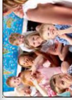
BørneIntra - Minivejledning © KMD A/S 2014